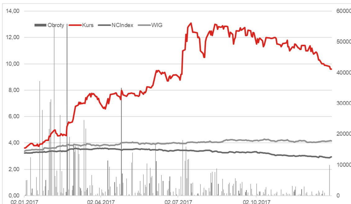
Wykres 3 Notowania akcji spółki LUG S.A. w okresie 01.01.2017 – 31.12.2017 r.

W 2017 roku kurs akcji spółki LUG S.A. przez większość okresu wykazywał silne tendencje wzrostowe. Najniższą wartość w pierwszym kwartale osiągnął dn. 02.01.2017 r., kiedy cena akcji wyniosła 3,61 PLN. Najwyższa cena obserwowana w pierwszym kwartale to 7,77 PLN za akcję LUG z dnia 22.03.2017r. Po wahaniami z początku drugiego kwartału i w konsekwencji spadku do najniższej wartości odnotowanej w drugim kwartale, czyli 6,57 PLN dnia 07.04.2017 r., nastąpiło wybiecie do poziomu 9,49 PLN (06.06.2017r.) Początek lipca przyniósł kolejne wzrosty z poziomu 8,77 PLN odnotowanego dn. 04.07.2017 roku do rekordowej wartości 13,10 PLN z dnia 17.07. br., będącej jednocześnie najwyższą wartością w całym 2017 roku. Do końca września ceny akcji kształtowały się na stabilnym poziomie, którym otworzył czwarty kwartał. Od początku października do końca roku kurs akcji wahał się w przedziale pomiędzy maksimum na poziomie 11,50 PLN (02.10.2017 r.) a minimum na poziomie 9,60 PLN (29.12.2017 r.), który był również wartością zamykającą rok 2017. Zestawiając wartość kursu akcji z początku i zamknięcia roku odnotowujemy rekordowy wzrost ceny akcji na poziomie +265%, co stanowi najwyższą roczną stopę wzrostu w historii spółki.